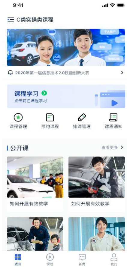
图 2 实训课预约与排课管理系统手机端界面