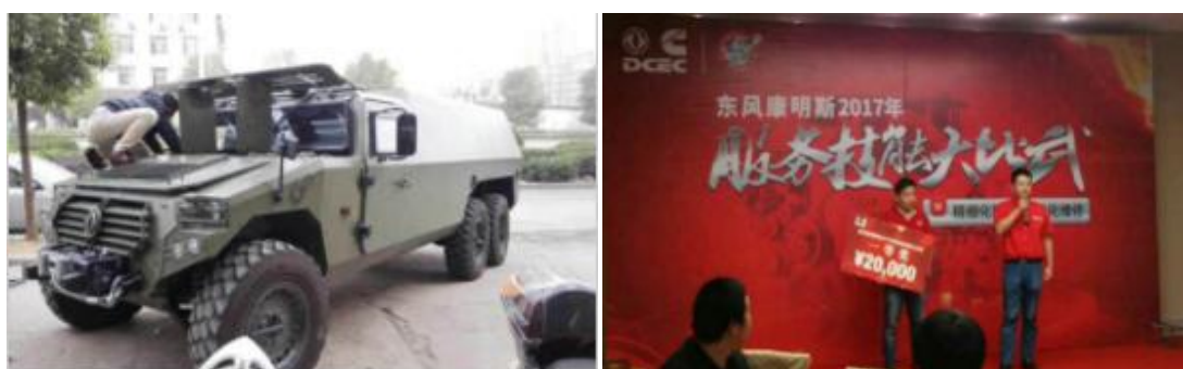
图 3 李红甫参加东风康明斯技能大比武

2010 年 9 月，李红甫进入襄阳职业技术学院汽车检测与维修技术专业开始了大学学习生涯，在第一学期顺利取得驾照，在课外时间担任驾校教练助理。2010 年襄阳云康工贸公司与襄阳职业技术学院成立“云康订单班”，他积极踊跃报名参加面试，成为云康订单班一员，在学习专业课的同时，他特别注重康明斯发动机的钻研。通过努力，他先后获得国家一等奖学金、学院奖学金、国家助学金；素质拓展先进个人、优秀学生干部；积极参加无偿献血及组织同学参加多项社团活动。