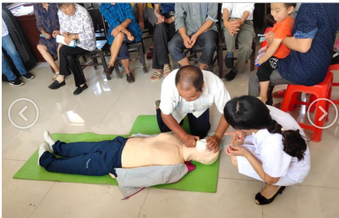
▼临床医学专业村医班学生举行知识竞赛