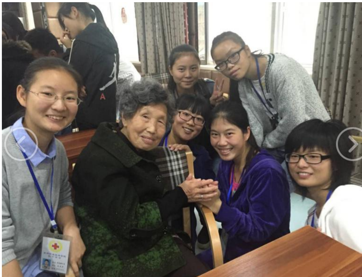
▼临床医学专业学生关爱老革命军人